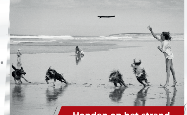
Honden op het strand

Vismarkt (Wallenstraat, t.h.v. huisnummer 8)