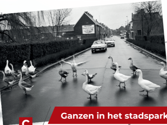
Ganzen in het stadspark

Deze foto, genomen in januari 1986, is een momentopname van overstekende ganzen in de Weststraat van het ene deel van het Geitepark naar het andere. Met deze foto won ik de Gouden Lens in Knokke-Heist en de foto verscheen toen in verschillende buitenlandse kranten en tijdschriften.